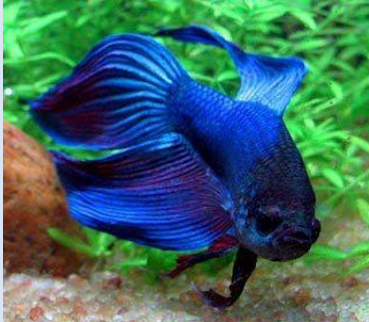
Longtail Betta Assorted MALE