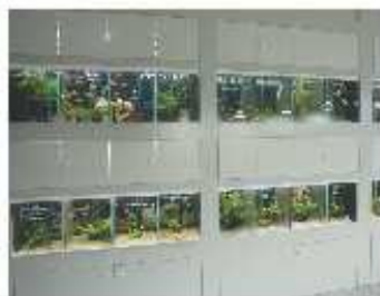
Verschillende vissoorten in de visstelling