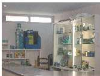
Winkel met diverse soorten vis en plantenvoeding