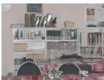
Alles over vis en planten in de bibliotheek