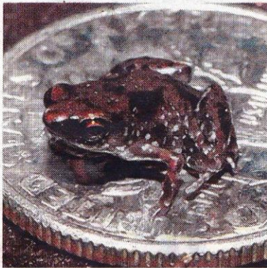
Kikkertje van 7,7 millimeter.