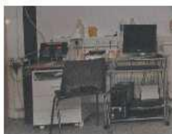
Watermeetapparatuur en een computer